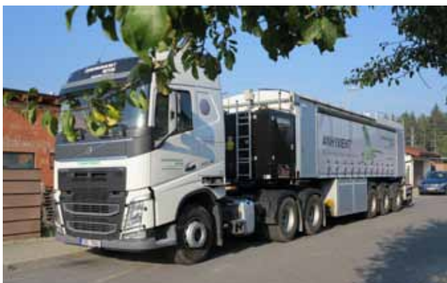
2 Přejezd mobilní výrobní linky na stavbu