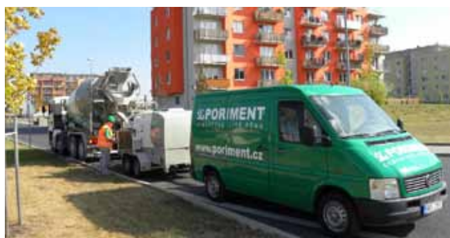
■ PORIMENT® - výrobní technologie na stavbě