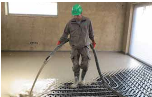
6 Realizace lité podlahy