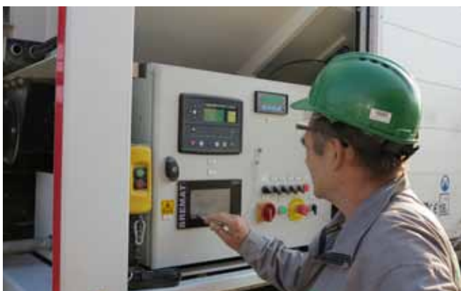
5 Čerpání litého potěru na stavbě z mobilní výrobní linky