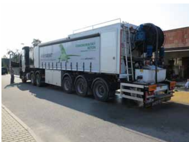
■ ANHYMENT® - mobilní výrobní zařízení na stavbě