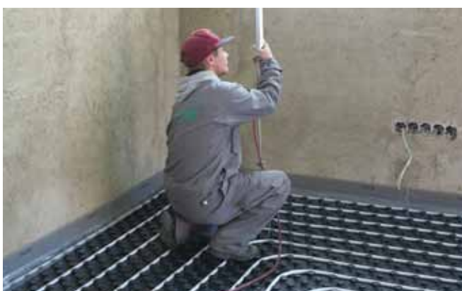
3 Nastavení výšky litého potěru