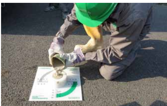
4 Zkouška rozlivu litého potěru