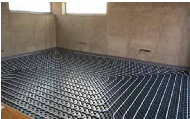
1 Příprava prostor s podlahovým topením k lití potěru