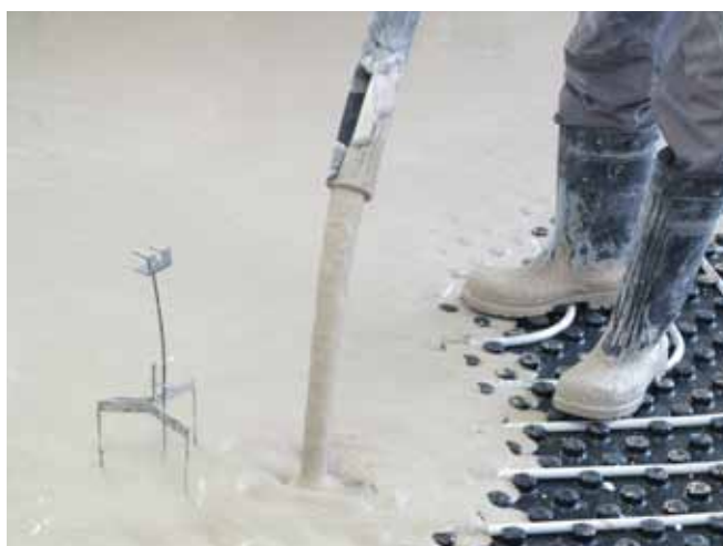
■ ANHYMENT® - realizace lité podlahy