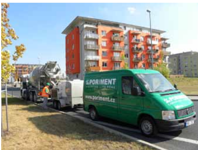
■ PORIMENT® - výrobní technologie na stavbě