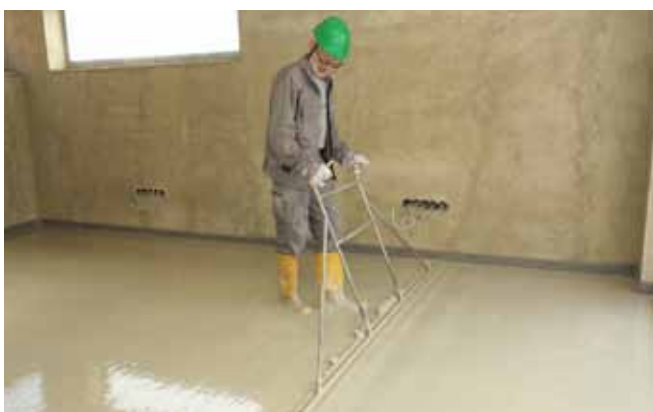
7 Hutnění - hrubé urovnění litého potěru