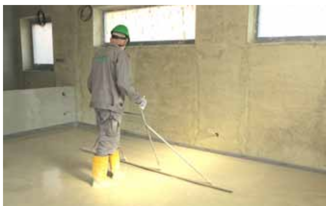
8 Nivelace - konečné urovnění litého potěru