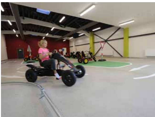
■ CEMFLOW®Look - architektonické řešení podlahy