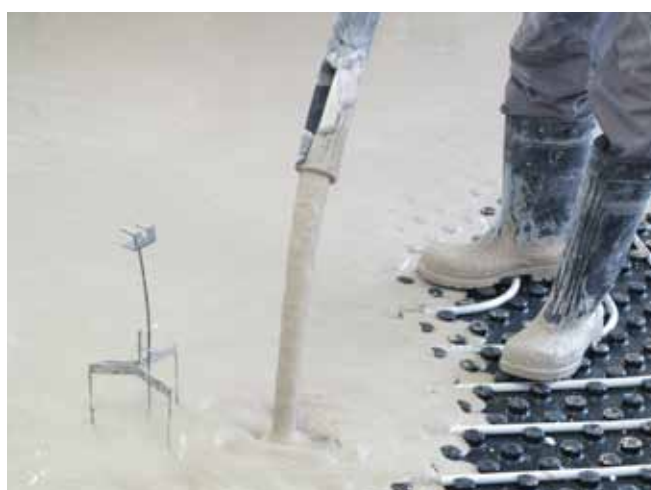
■ ANHYMENT® - realizace lité podlahy