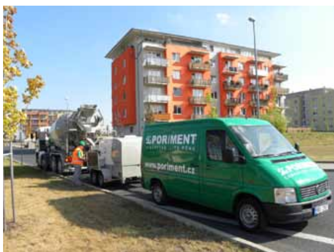
■ PORIMENT® - výrobní technologie na stavbě