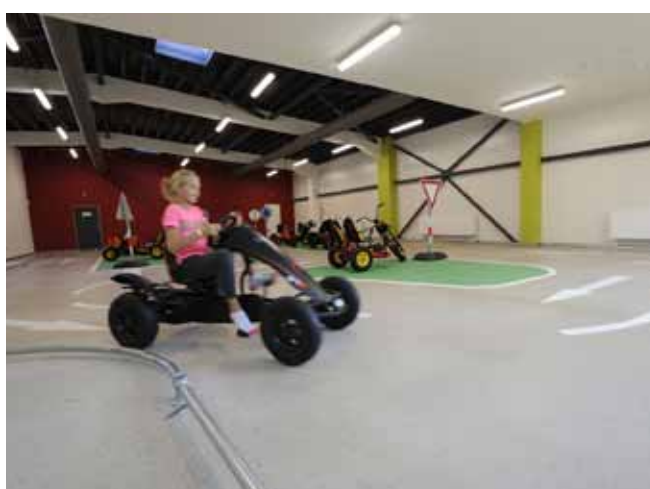
■ CEMFLOW®Look - architektonické řešení podlahy