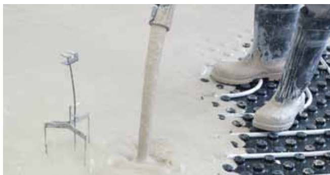
■ ANHYMENT® - realizace lité podlahy