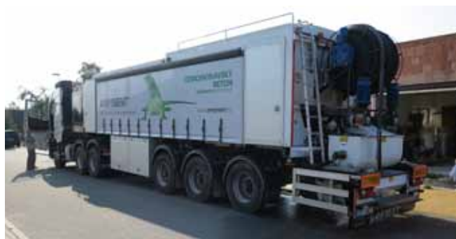
■ ANHYMENT® - mobilní výrobní zařízení na stavbě