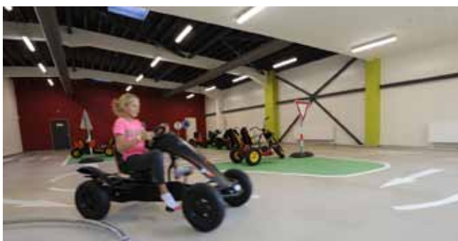
■ CEMFLOW®Look - architektonické řešení podlahy