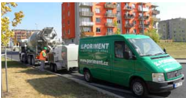
■ PORIMENT® - výrobní technologie na stavbě